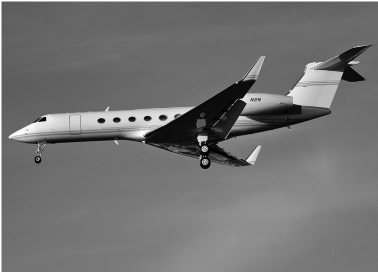
Реактивный самолет бизнес-класса Gulfstream G550 , предоставленный фирмой «Apple» Джобсу в личное пользование