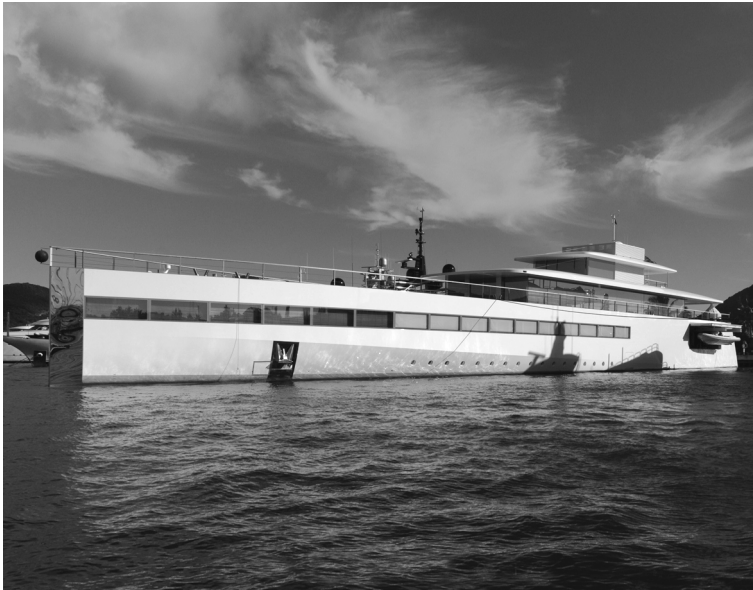
Яхта Стивена Джобса «Venus»