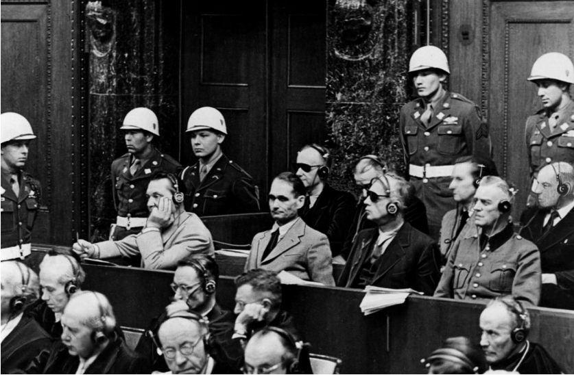
Левая сторона скамьи подсудимых. В первом ряду: Герман Геринг, Рудольф Гесс, Иоахим фон Риббентроп, Вильгельм Кейтель; во втором ряду: Карл Дёниц, Эрих Рэдлер, Бальдур фон Ширах, Фриц Заукель

сомнениям, для этого нужно, как минимум, еще одно такое же масштабное и серьезное мероприятие. Показать сущность нацистского режима и был призван процесс. И, несмотря на то, что англичане и в какой-то мере американцы постоянно пытались свернуть его в формальное русло стандартной процедуры, т. е. суда над конкретными людьми, процесс своей цели достиг.